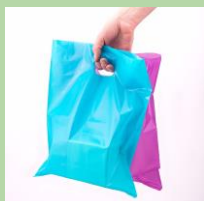
Пакеты с прорезными ручками