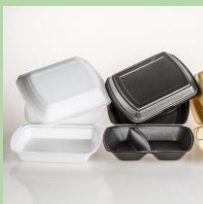
Контейнеры для еды на вынос