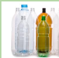
Прозрачные ПЭТ-бутылки разных оттенков