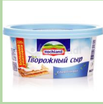
С впаянной этикеткой