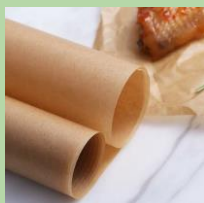
Силиконизированный пергамент для выпечки