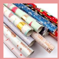
Подарочные бумажные пакеты/бумага