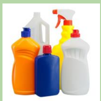
Бутылки и флаконы