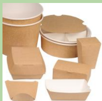
"Бумажные" контейнеры для еды