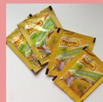
Упаковка 4 c/ldpe