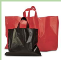
Пакеты с пластиковыми ручками