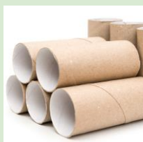
Втулки (от туалетной бумаги и т.д.)