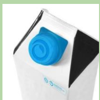
Крышки от тетрапака