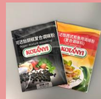
Упаковка 4 c/lдpe