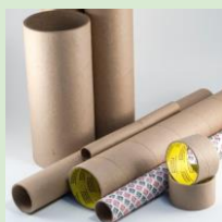
Шпули (от бумажных полотенец, фольги и т.д.)