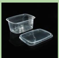
Контейнеры/ лотки прозрачные