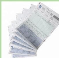
Бумага с копировальным слоем