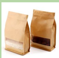
Бумажные пакеты с прозрачным окошком