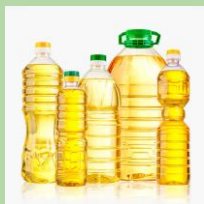
Тара из-под растительного масла