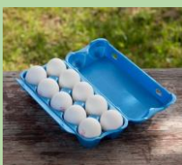
Лотки из-под яиц