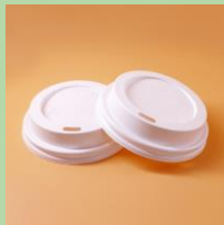
Крышечки от стаканов на вынос