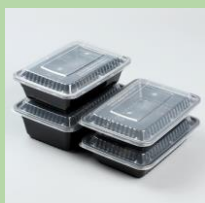
ПЭТ-контейнеры (только прозрачная часть)