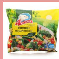
Упаковка 4 c/ldpe