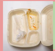
Грязное / с остатками пищи