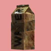
Грязный и мокрый тетрапак

Подготовка к сдаче: 1. Сполоснуть. 2. Компактно сложить (по возможности)