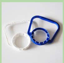
Пластиковые ручки от 5л и 19л ПЭТ-бутылок