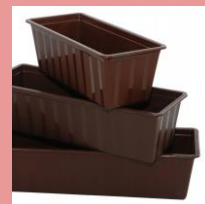
Цветной небутилированный ПЭТ