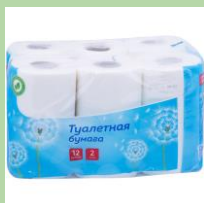
Цветная плёнка 4 LDPE (от туалетной бумаги, бумажных полотенец и т.д.)