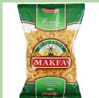
Цветная плёнка 5PP