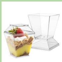
Стаканы из-под десертов