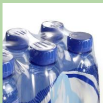
Термоусадочная группировочная плёнка