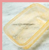
Грязные контейнеры/ с остатками пищи

Подготовка к сдаче: 1. Сполоснуть 2. Удалить остатки фольги при наличии 3. Компактно сложить (по возможности)