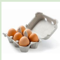
Лотки из-под яиц