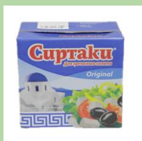
"Коробка" из-под сыра в рассоле