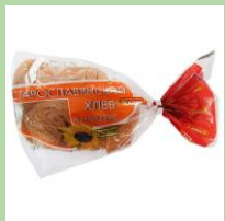
Цветная плёнка 5PP