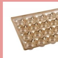
Цветной небутилированный ПЭТ