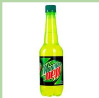
ПЭТ-бутылки кислотных цветов