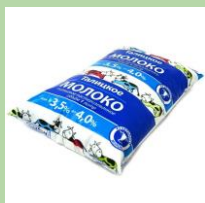
Пакеты из-под кисломолочных продуктов