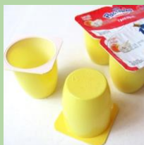
Стаканчики из-под кисломолочной продукции