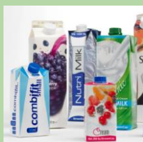
"Коробки" из-под сока, молока и др. напитков