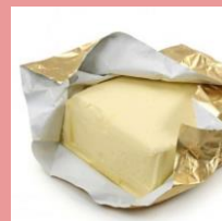
Фольгированная бумага из-под масла