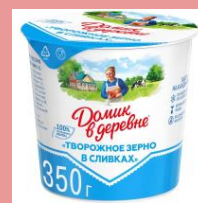
Контейнеры с этикетками / остатками фольги