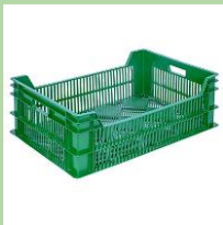
Овощные/ фруктовые лотки