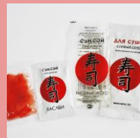
Упаковка 4 c/lдpe