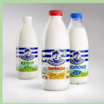
Бутылки из-под кисломолочной продукции