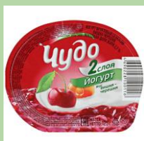
Крышечки с металлическим слоем