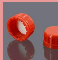
Крышки с прорезиненной прокладкой